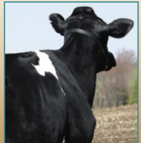
El rasgo de Forma Lechera se agregará a la fórmula del TPI™ en febrero del 2005, beneficiando a los toros con un PTA más bajo en Forma Lechera.

La correlación entre el TPI™ actual y el nuevo es del 99 por ciento. Por lo tanto en general el “ranqueo” relativo de los toros no cambiará. Sólo los toros extremos en algunos de los nuevos rasgos se espera que cambien su posición considerablemente. El TPI™ es calculado por la Asociación Holstein -USA.