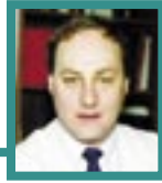
POR STEVE SCHNELL VICE-PRESIDENTE, GENÉTICA LECHERA

las vacas Holstein nacidas en el 2000 es 592 Libras más alto, en promedio, que el de las vacas Holstein nacidas en 1995. Cuando la base cambie, la vaca promedio nacida en el 2000 va a cambiar a "cero"; por lo tanto, la evaluación genética de todas las Holstein en leche se va a reducir en aproximadamente 592 Libras.