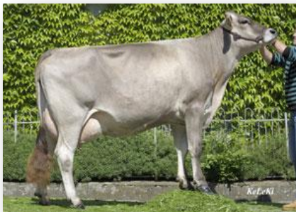
Hija: Würth's Cowboys DOLI

INDICE DE MERITO TOTAL 107 Vida productiva 105 71 hatos 81 hijas Comp. Ubre +0.45 Leche +476 kg 89% Conf. Comp. PyP +0.24 Grasa - 1 kg -0.28% CCS 93 Proteína + 19 kg +0.03% Facilidad Parto 112