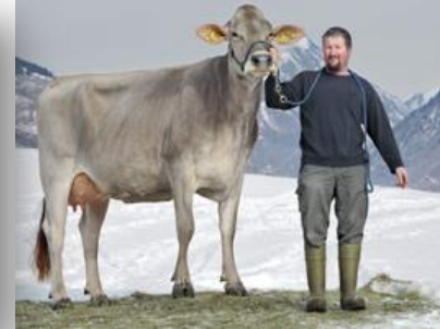
Hija: Frusetta V.I.P. Leonie_Elmo

INDICE DE MERITO TOTAL 109 Vida productiva 109 59 hatos 64 hijas Comp. Ubre +1.42 Leche +348 kg 90% Conf. Comp. PyP +0.97 Grasa + 15 kg +0.03% CCS 103 Proteína + 12 kg +0.00% Facilidad Parto 96