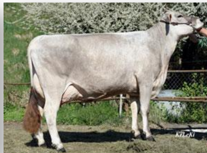
Hija: Bachofen's Joystick VALENZIA

INDICE DE MERITO TOTAL 116 Vida productiva 104 72 hatos 80 hijas Comp. Ubre +1.51 Leche +479 kg 91% Conf. Comp. PyP +0.67 Grasa + 31 kg +0.16% CCS 109 Proteína + 20 kg +0.05% Facilidad Parto 99