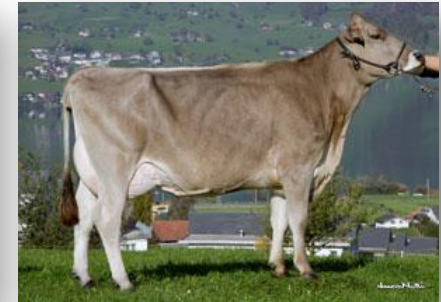
Hija: Omlin Primo Pietra

INDICE DE MERITO TOTAL 115 Vida productiva 113 236 hatos 320 hijas Comp. Ubre +2.05 Leche +372 kg 97% Conf. Comp. PyP +0.03 Grasa + 14 kg -0.02% CCS 119 Proteína + 22 kg +0.12% Facilidad Parto 105