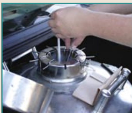
Remueva el semen del tanque de nitrógeno.