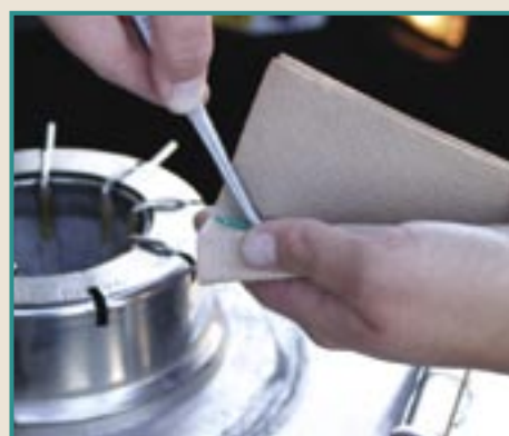
Coloque la pajuela de semen dentro de la toalla.