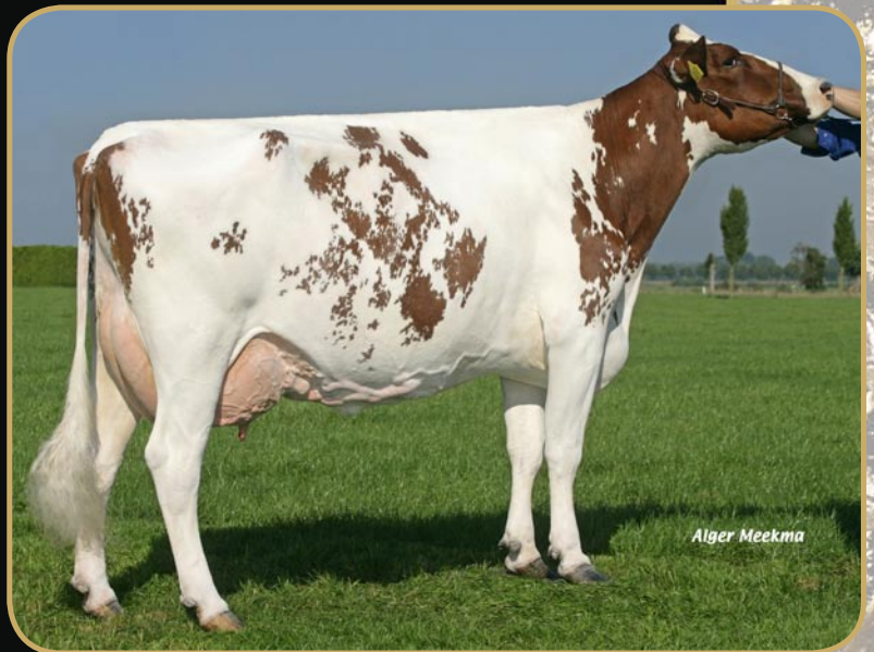
Gonnie 122 MB86-2años (foto de segunda lactación)