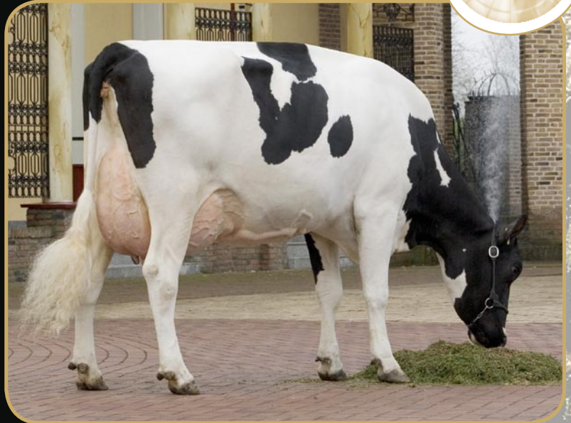
Wietske 9122 MB86-3años (foto de segunda lactación)