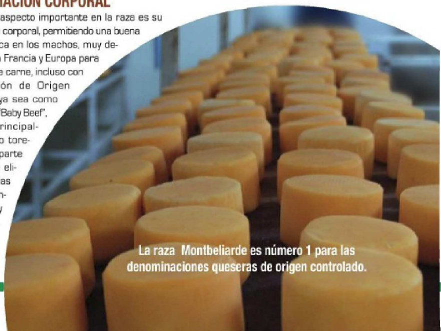
La raza Montbeliarde es número 1 para las denominaciones queseras de origen controlado.

La raza ha tenido un exitoso desarrollo internacional, adaptándose y respondiendo de manera eficiente a diferentes condiciones climáticas, sistemas de manejo y alimentación, tanto en raza pura como en cruzamiento con distintas razas lecheras, especialmente sobre vacas Holstein.