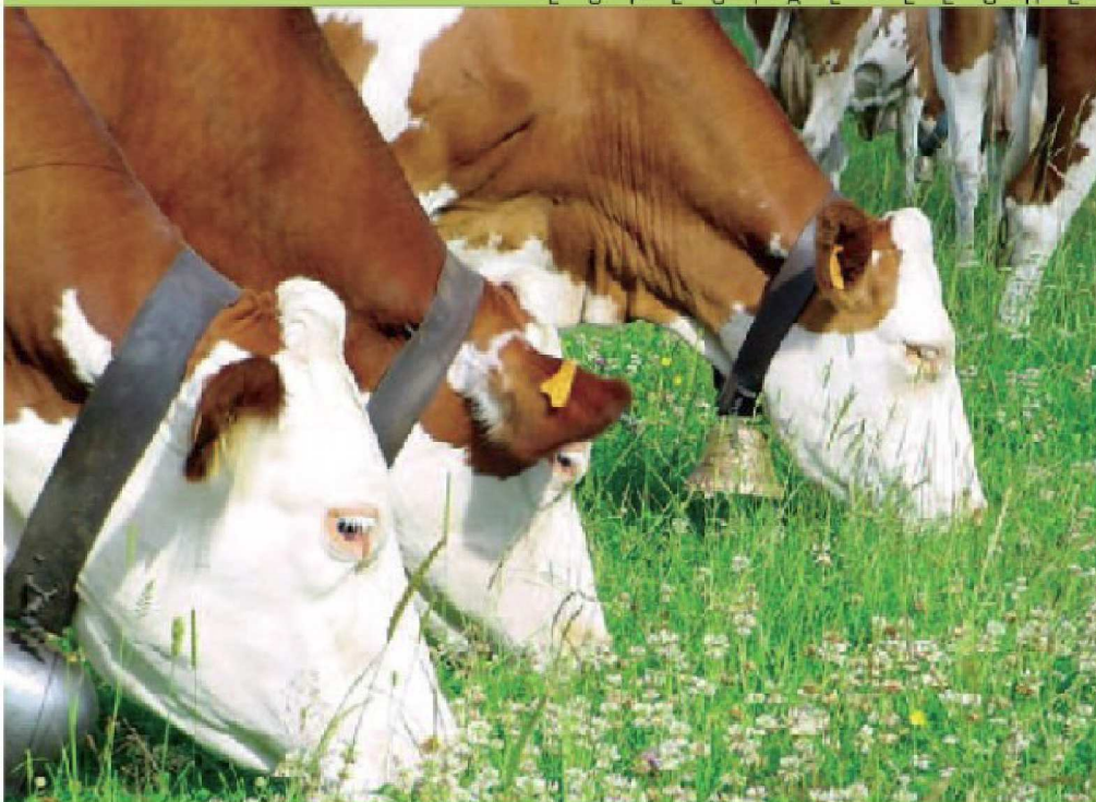
Vacas Montbeliarde en sistema pastoril en Francia.

La Montbeliarde pertenece a las denominadas razas rojas de montaña, sus ancestros llegan desde Suiza a Francia en el Siglo XVIII, a la región de Montbeliard, cruzándose con razas locales y dando origen a la raza Montbeliarde, la que es oficialmente reconocida el año 1889 con la creación del Herd Book, actual UPRA Montbeliarde.