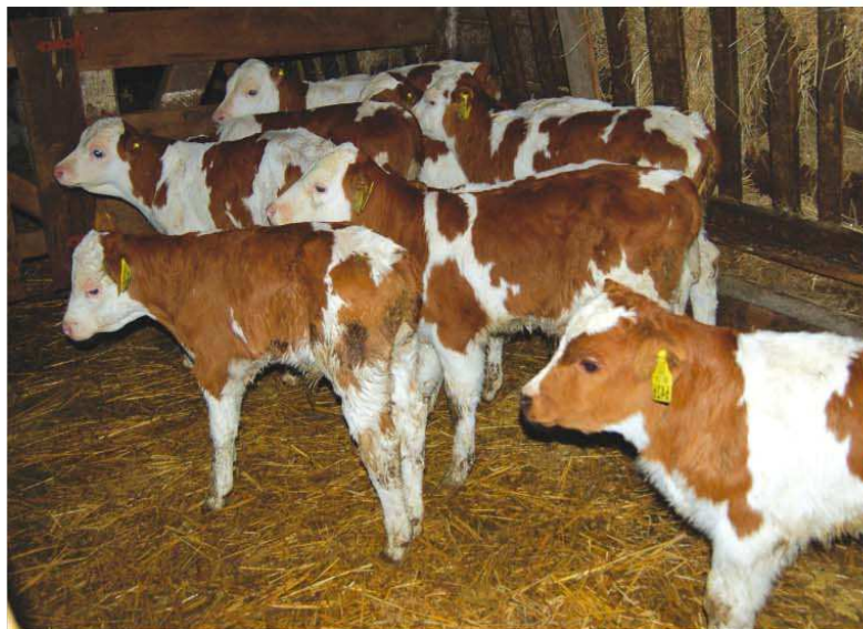
Entusiasta de las rojo con blanco, Manuel Campo insemina toda su lechería con toros Montbeliarde. Insemina año redondo, así obtiene mejores indicadores reproductivos y no deja vaca sin preñar entre temporadas.